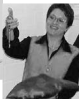
Eröffnung Vereinslokal im SportPark- Gebäude mit feierlicher Schlüsselüber- gabe.