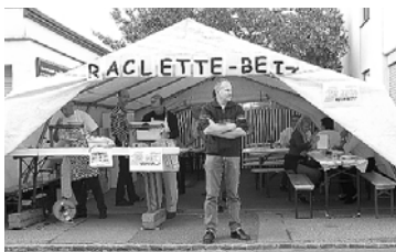
Chilbi Rotkreuz Raclette-Beiz Staff